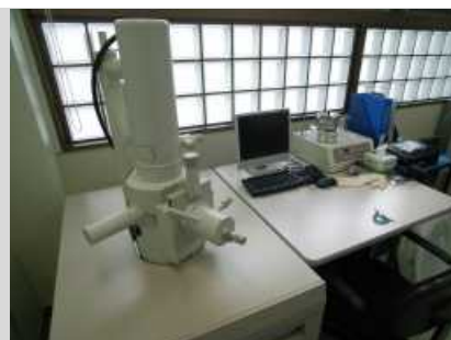
走査型電子顕微鏡