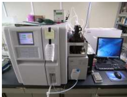
ゲル透過クロマトグラフィー